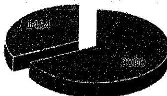
Zaopatrzenie w wodę przeznaczoną do spożycia przez ludzi w Gminie Łękawica w 2018r.

W Gminie Łękawica na koniec 2018r. na pobyt stały zameldowanych było 4 454 mieszkańców. Około 3000 z nich, t.j. około 67,4 % mogło pobierać wodę z wodociągu zbiorowego zaopatrzenia w wodę. Pozostali mieszkańcy korzystali z wody dostarczanej przez prywatne wodociągi, które nie posiadają zarządcy odpowiedzialnego za jakość produkowanej wody lub studni indywidualnych.